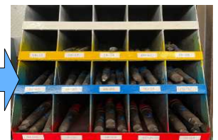
道具（キリ）の収納改善